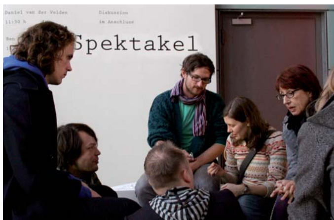
Die Staatliche Akademie der Bildenden Künste Stuttgart hat mit Studiengebühren ein Symposium veranstaltet. Unter dem Titel „Spektakel“ haben Gastreferenten mit den Studierenden diskutiert.