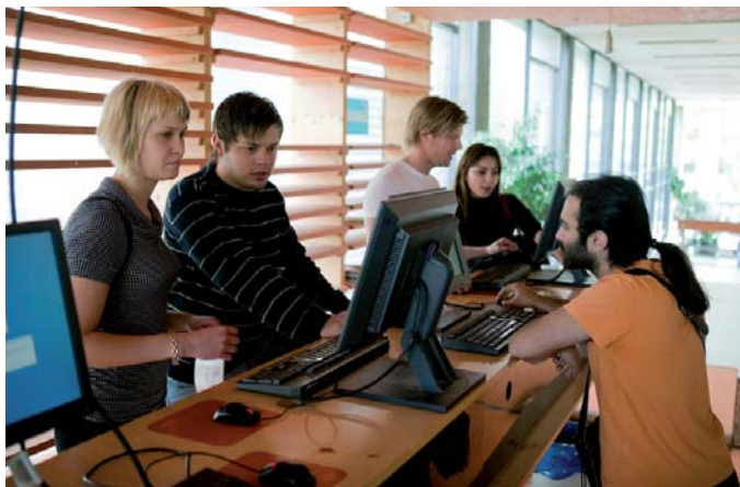
Die Ausstattung der PC-Pools hat sich durch Studiengebühren verbessert. Hier ein Bild aus der Universität Stuttgart.

Mit den Studiengebühren übernehmen die Studierenden Mitverantwortung für die Kosten eines qualitativ hochwertigen Studiums. Das soll jedoch nicht dazu führen, dass Studierende mit einem zu hohen Schuldenberg in das Berufsleben starten. Deshalb gibt es in Baden-Württemberg eine Höchstgrenze der Zahlungspflicht von 15.000 Euro. Die Gesamtsumme der zurückzuzahlenden BAföG-Mittel und des Darlehens einschließlich Zinsen ist auf diesen Betrag gesetzlich begrenzt. Konkret bedeutet das für Sie zweierlei: Erstens wissen Sie bereits vor Studienbeginn, wie hoch Ihre maximale Belastung sein wird. Und zweitens bedeutet die Kappungsgrenze für zahlreiche BAföG-Empfänger, dass es das Gebührendarlehen ohne Zinsen gibt. Denn wer 10 Semester studiert und den durchschnittlichen BAföG-Satz bekommt, der erreicht zusammen mit den Studiengebühren die 15.000-Euro-Grenze. Die Zinszahlungen fallen dann weg.